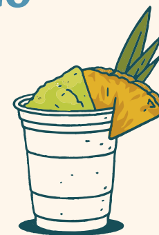
Mezcalita Acapulco 370ml Ginger, maracuyá, limon, curasao, mezcal.

¿Te gusta ver antes de pedir? Escanea el QR y antómate con fotos reales de todos nuestros productos.