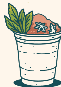
Mezcalita Vallarta 370ml Ginger, limón, naranja, jamaica, mezcal.